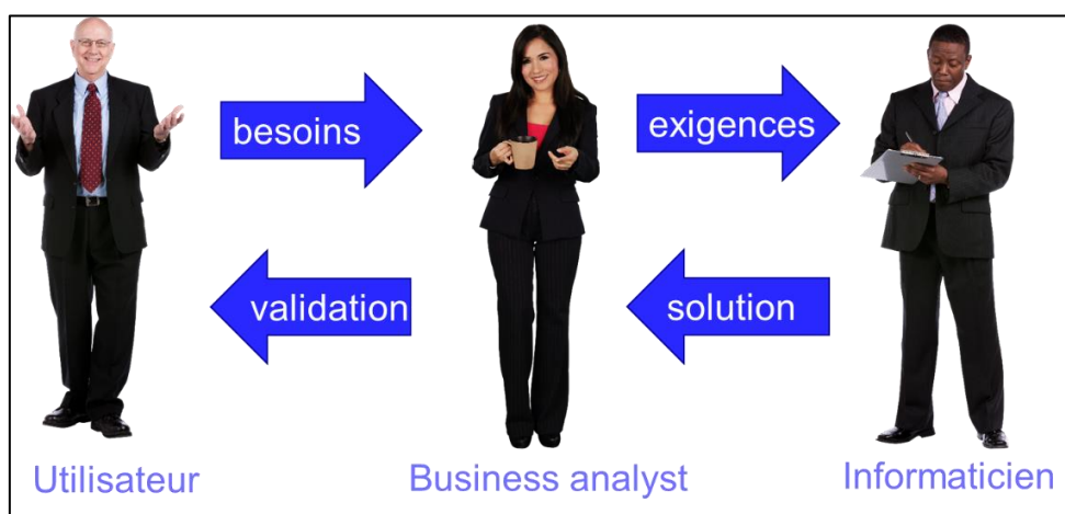
Figure 1 : le métier de business analyst

Le business analyst intervient dans des projets de développement informatique. Il définit d'abord les attentes d'un futur système informatique avec les utilisateurs. Il interagit ensuite avec les informaticiens pour construire ce système et le valider.