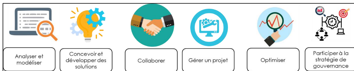
Figure 2 : objectifs d'apprentissage du master en Business Analyst

Les business analysts sont préparés à occuper une fonction centrée sur la transformation digitale. Ils seront capables d'optimiser, de formaliser et d'automatiser les processus d'affaires en activant les technologies digitales les plus performantes. Pour cela, les étudiants vont développer les objectifs d'apprentissage visés par le master à travers les cours et le stage :